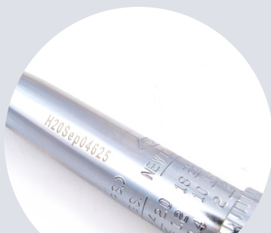
Numer identyfikacyjny Identification number