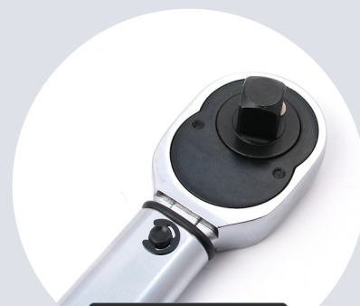
Rozmiar 1/2" 1/2" size