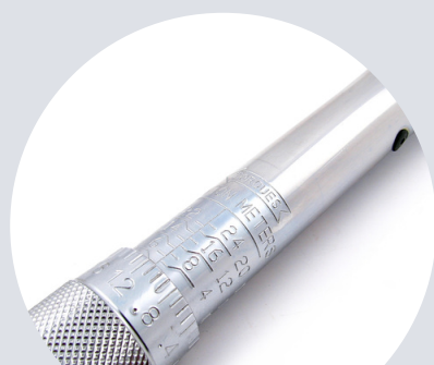
Wygrawerowana skala Engraved scale