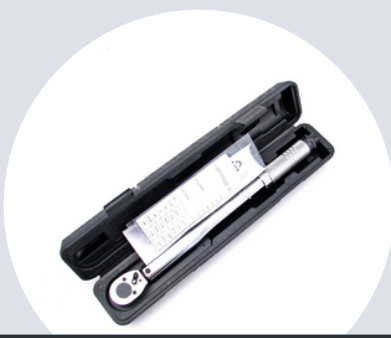
Pudełko z certyfikatem i instrukcją Box with certificate and manual