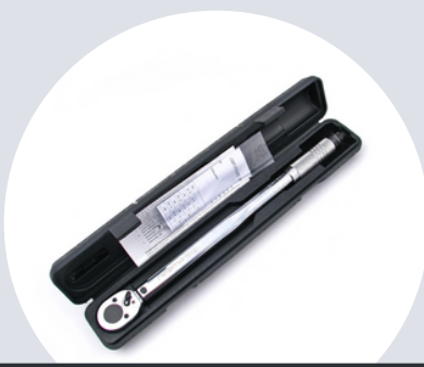
Pudełko z certyfikatem i instrukcją Box with certificate and manual