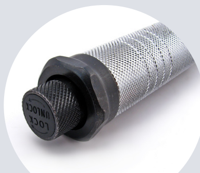
Blokada momentu Torque lock