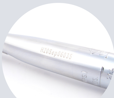
Numer identyfikacyjny Identification number