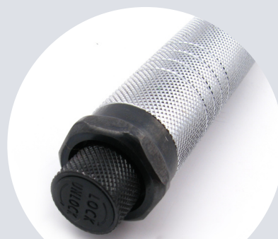
Blokada momentu Torque lock