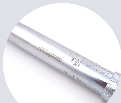
Numer identyfikacyjny Identification number