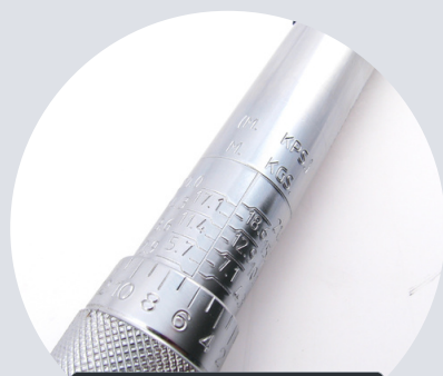
Wygrawerowana skala Engraved scale