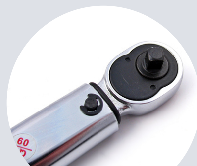
Rozmiar 1/4" 1/4" size