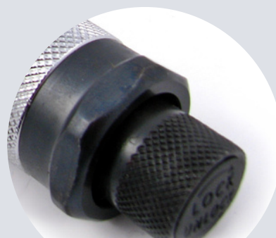
Blokada momentu Torque lock