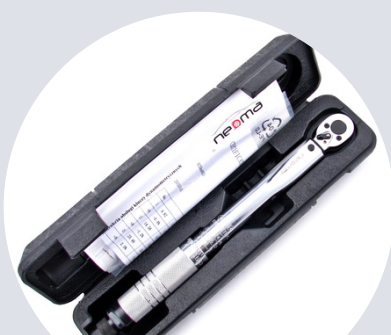
Pudełko z certyfikatem i instrukcją Box with certificate and manual