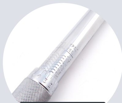
Wygrawerowana skala Engraved scale