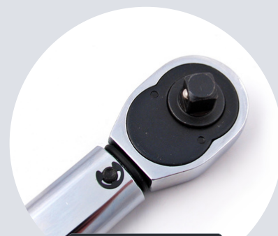
Rozmiar 3/8" 3/8" size